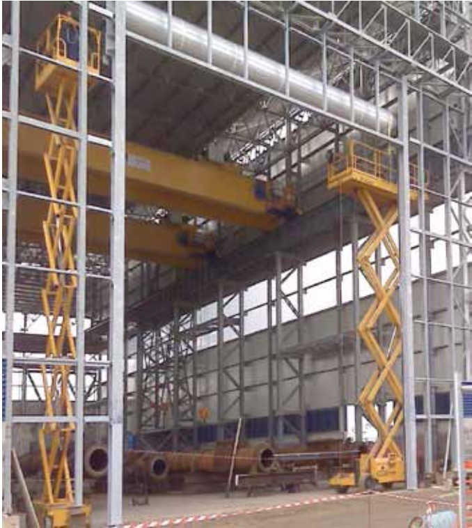
Serranda avvolgibile WINDDoor®: larghezza metri 12 per altezza metri 14

Grande chiusura per grandi dimensioni Roller shutter for large accesses