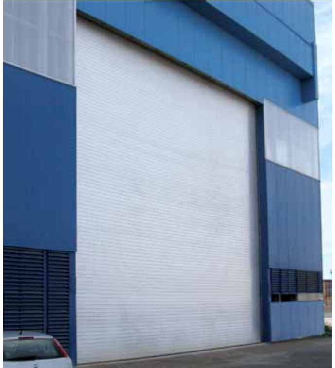
WINDDoor® roller shutter: 12 meters width by 14 meters height